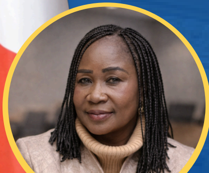
Vicky KATUMWA Sénatrice RDC