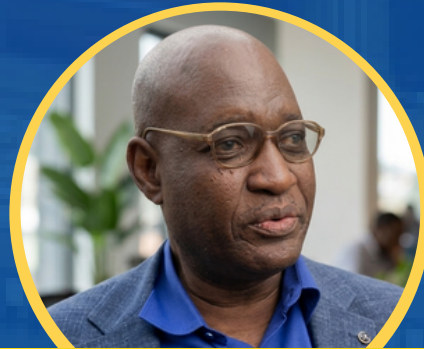
Aristide BULAKALI Député RDC