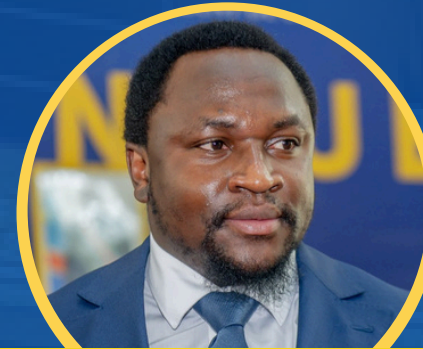
Alfred DIBANDI NZONDOMYO Député RDC