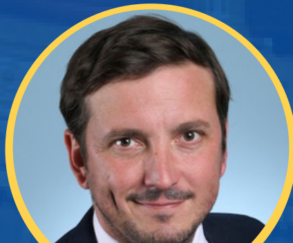
Aurelien TACHÉ Député du Val d'Oise